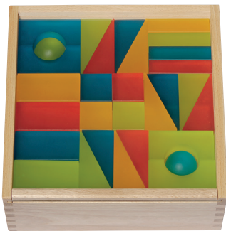
103 162 Lumi