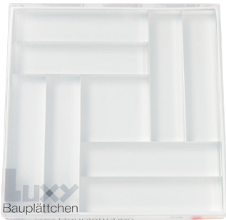
103 541 Luxy Bauplättchen