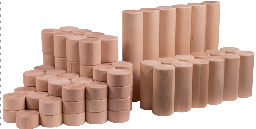
183 202 Uhl Riesen Säulen